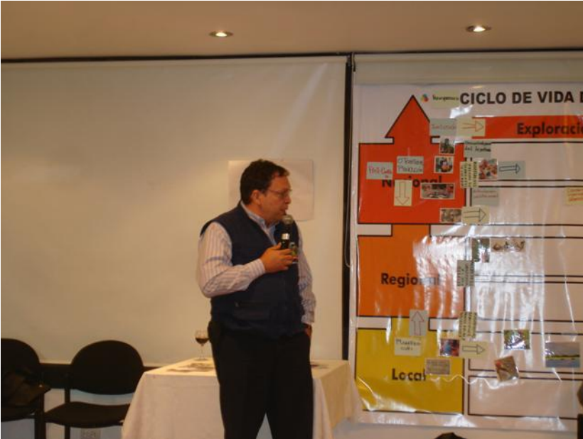
Imagen 2: Presentación de observaciones y decisiones- actividad ciclo minero.

Durante el ejercicio de conversación y análisis del ciclo minero frente a las imágenes propuestas los participantes entablaron conversaciones sobre diferentes temáticas, además de las recomendaciones mencionadas. Temáticas que deberán discutirse en la MDP y en otros espacios para generar una información clara y coherente frente al tema de la minería en el país y para poder tomar mejores decisiones de exploración y explotación.