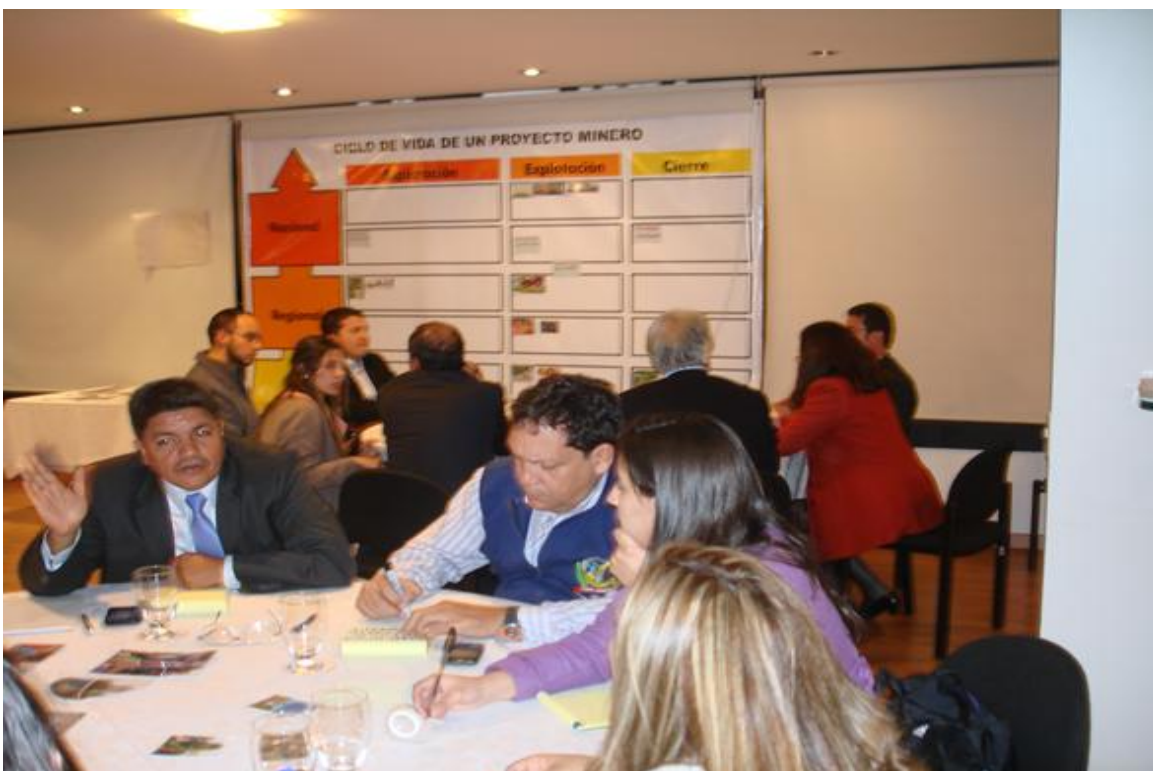
Imagen 1. Fotografía de las mesas redondas. Trabajo en equipo. Análisis de las imágenes.

Dentro de las recomendaciones generadas por los participantes de la mesa, respondiendo a la siguiente pregunta, si fueran asesores del Ministerio de Minas y Energía, qué sugerencias y recomendaciones darían para construir una minería que las comunidades quieran proteger y se sientan orgullosa?, como principales, surgieron las siguientes: